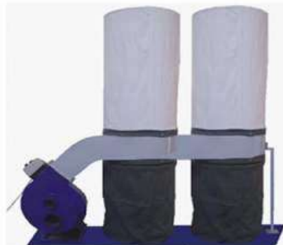
Дуэт-2 и Квадро